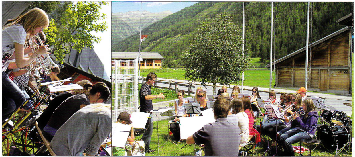
Den Teilnehmern des Jugend-Musiklagers in Obergesteln hat sich bei guter Witterung die Möglichkeit geboten, im Freien zu üben.

gleich geblieben. Im Falle einer grösseren Teilnehmerzahl oder schlechtem Wetter hätte man auch das Gemeindehaus in Obergesteln mitbenützen können.