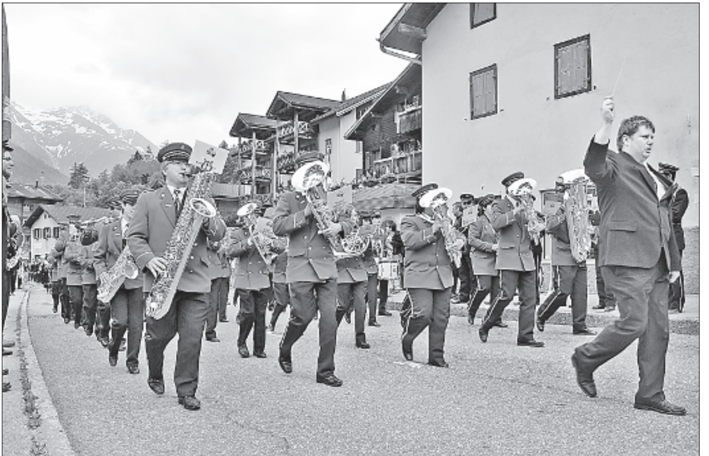
Die Darbietungen der Oberwalliser Musikvereine vermochten die Jury zu überzeugen.